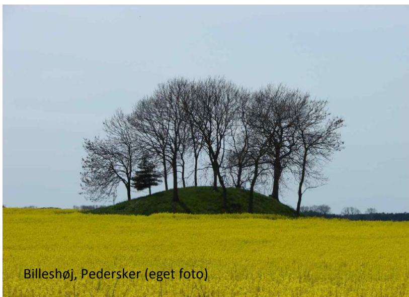
Billeshøj, Pedersker

Det er vores håb at underjordiske.dk udover at skabe og formidle viden, vil bidrage til igen at skabe respekt for det kulturelle landskab. Måske denne respekt, sammen med fredninger, kan overtage de underjordiskes rolle som værnere af fortidsminderne."