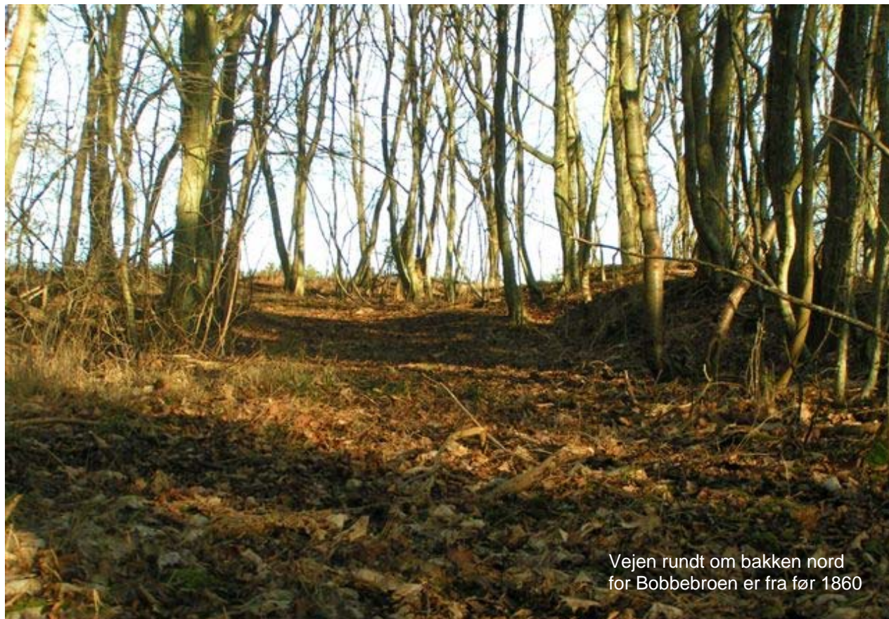
Vejen rundt om bakken nord for Bobbebroen er fra før 1860

Fra broen er der tegnet en brun smal vej, der snor sig fra Østerlars-siden af åen over broen, op forbi den stejle skrænt og rundt om bakken, indtil den oppe på markerne i Rø slår nogle buer mod vest, op mod Rø by. Det vil sige, at den vej har været i brug inden 1860, og alle de hulveje, der går fra broen lige op over skrænten, må være endnu ældre, som jeg også skrev i den første artikel - sandsynligvis flere hundrede år gamle.