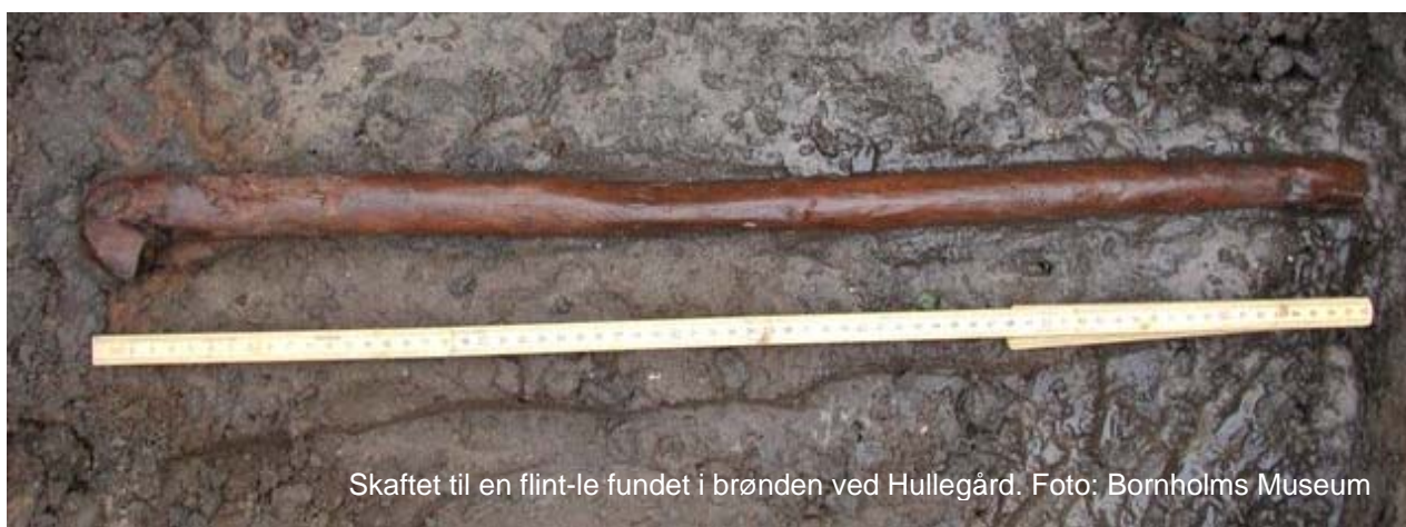
Skaftet til en flint-le fundet i brønden ved Hullegård.

hente vand i kilden i oldtiden, eller dyr, der skulle drikke af vandet. Stolperne er ikke aldersbestemt endnu, men deres placering under jordlaget med le-skaftet kunne tyde på, at brønden er lige så gammel som hustomterne med mikrolitterne: Fra Maglemosetiden, ca. 8000 – 7000 f.Kr. Og nu skal man altså prøve at finde ud af, om brønden rummer flere fund.