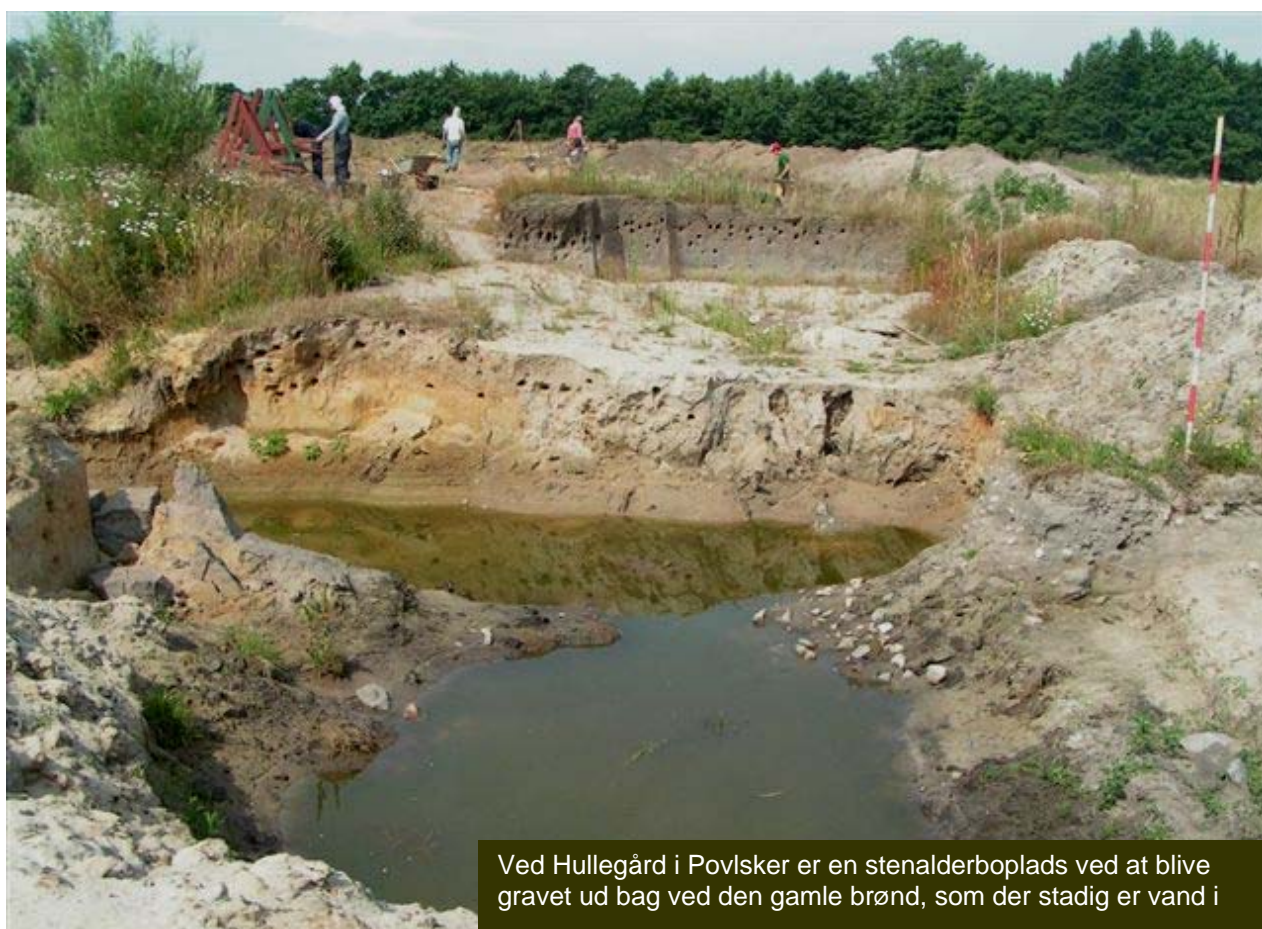
Ved Hullegård i Povlsker er en stenalderboplads ved at blive gravet ud bag ved den gamle brønd, som der stadig er vand i

På en lille sandskrænt ved et vandhul bag en eng ved Hullegård i Povlsker sidder nogle grønne frøer og nyder sommersonen. I en anden skrænt lidt derfra smutter digesvalerne ud og ind af en tæt række huller. Hverken dyr eller fugle lader til at bemærke nogle arkæologer, der graver på den sandede mark ovenfor, og at én ved vandhullet sætter en larmende benzin-pumpe i gang, som sprøjter vandet gennem en slange langt væk ud på engen bagved. Vandet skal væk for at se, hvor hurtigt det igen løber til den gamle kilde, og for at arkæologerne kan grave længere ned i sandet – imens frøerne stadig nyder solen og den pyt vand, der er tilbage.