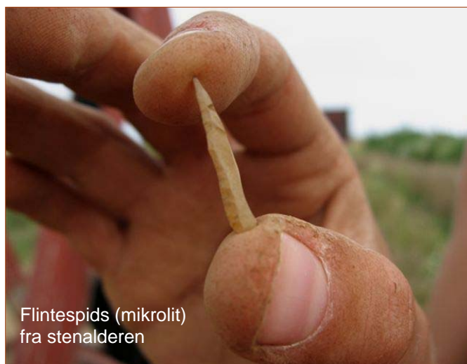
Flintespids (mikrolit) fra stenalderen

Så der var store forventninger til at finde mere – redskaber, keramik eller personlige ting – da et hold studerende fra Konservatorskolen i København i forsommeren gik i gang med at grave kilden ud. Det blev ikke til så mange fund, men man fandt enden af syv tilspidsede pæle, stukket dybt ned i kilden, som en kant om en træbrønd, samt to parallelle rækker mindre pæle på begge sider af kilden som funderingen til en gangbro for folk, der skulle