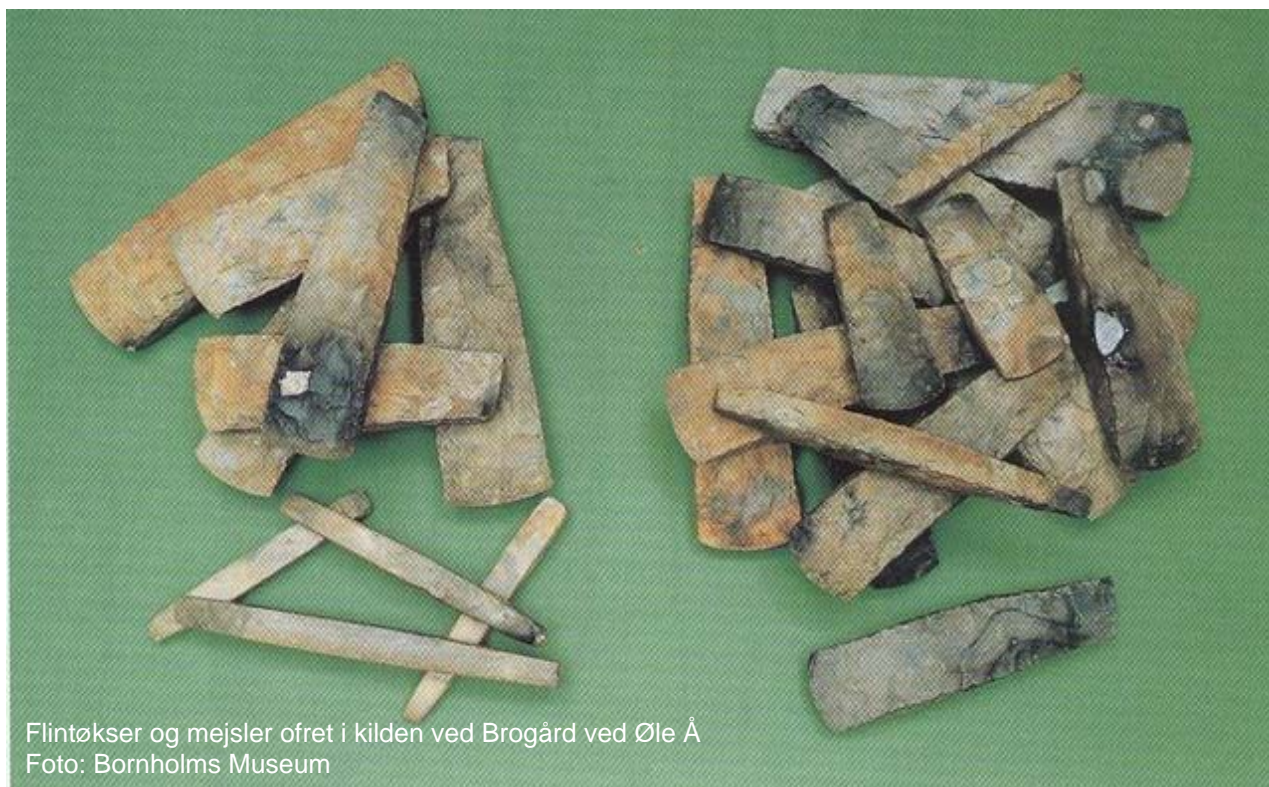
Flintøkser og mejsler ofret i kilden ved Brogård ved Øle Å

Oldtidens og middelalderens folk har sikkert søgt til kilderne, fordi vandet var renere og mere friskt end vandet i bække, åer og søer, og dermed også sundere, og hvis én er kommet til at vaske sig i en kildes vand og har oplevet at være blevet rask, er man begyndt at tro på en særlig helbredende kraft i kildens vand. En kendsgerning er i hvert fald, at folk siden de ældste tider har dyrket særlige kilder som hellige ved at drikke eller vaske sig i vandet, ofre til kilderne, holde ritualer og fester omkring dem og give dem navne. Årets store kildefester blev holdt ved midsommer – Sankt Hans, hvor folk mente, at kilderne havde størst helbredende kraft, men man kunne godt søge til dem hele året.