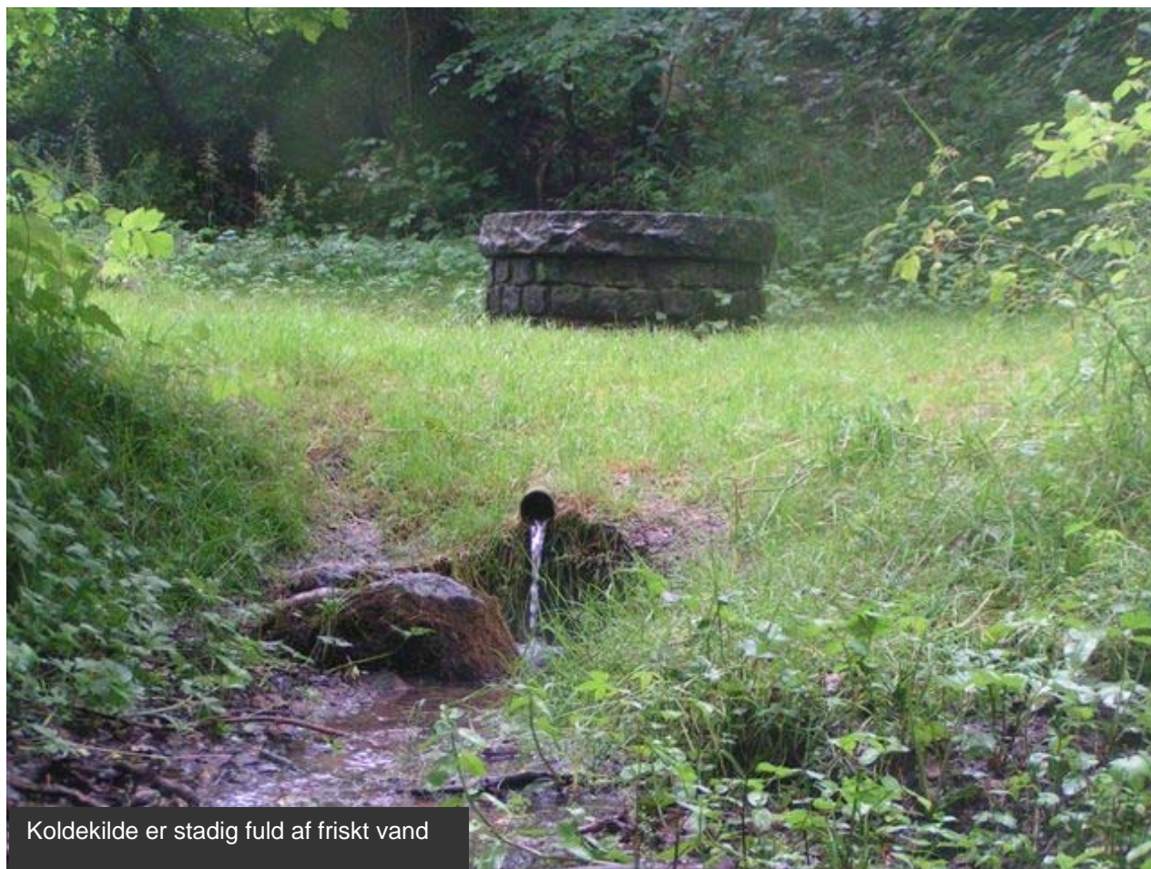
Koldekilde er stadig fuld af friskt vand

Den mest berømte af alle de bornholmske helligkilder er nok KoldeKilde i Almindingen, som stadig er fuld af koldt og klart vand. Den var stedet for gamle dages Sankt Hans fester, som bl.a. forfatteren Martin Andersen Nexø har beskrevet, og som i vore dage er fortsat som dyrskuerne i Hareløkkerne. Hvis man er på skovtur, så prøv at følge bækken hele vejen fra udløbet i Åremyre forbi KoldeKilde og videre over landevejen ned forbi Rømers Minde og Gamleborg til den munder ud i Læsåen i Ekkodalen. Det er en dejlig tur med muligheder for mange oplevelser.