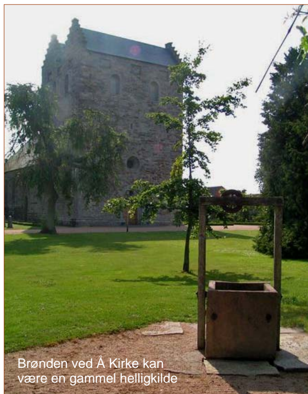
Brønden ved Å Kirke kan være en gammel helligkilde

Til gengæld betød det kristne forbud mod helligkilderne, at kilden i Muredal i Klemensker, nord for Gothegård, fik det onde navn Troldkilden, ligesom der gik sagn om, at de underjordiske badede deres børn i kilden. Det var åbenbart et sted, kirken ikke kunne bruge, så man i stedet måtte afskrække folk fra at komme der.