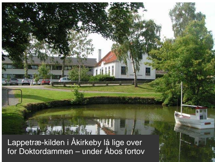
Lappetræ-kilden i Åkirkeby lå lige over for Doktordammen – under Åbos fortovej

Men nogle kilder fik direkte navn efter deres brug som helligkilder: Lappetræ Kilde eller Pengekilden ved Doktorbakken i Åkirkeby: Når folk havde besøgt kilden og var blevet